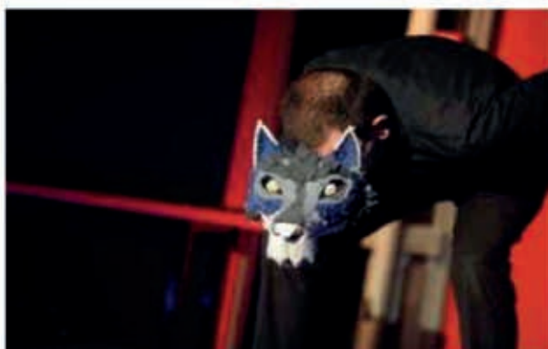
Le loup, c'est lui, à touche-touche avec le public.

Comment ? En rallongeant la scène jusqu'au milieu du public autour d'une valise mystérieuse. Les bancs, qui accueillent habituellement les spectateurs, ont disparu. Pierre, le loup, le canard, l'oiseau, le grand-père, les chasseurs, le chat viennent se frotter au public, quasiment à touche-touche. Pendant que flûte, hautbois, clarinette, basson, timbales, violons et cors chatouillent nos oreilles. « Sans dévoiler la création, on peut parler de notre volonté