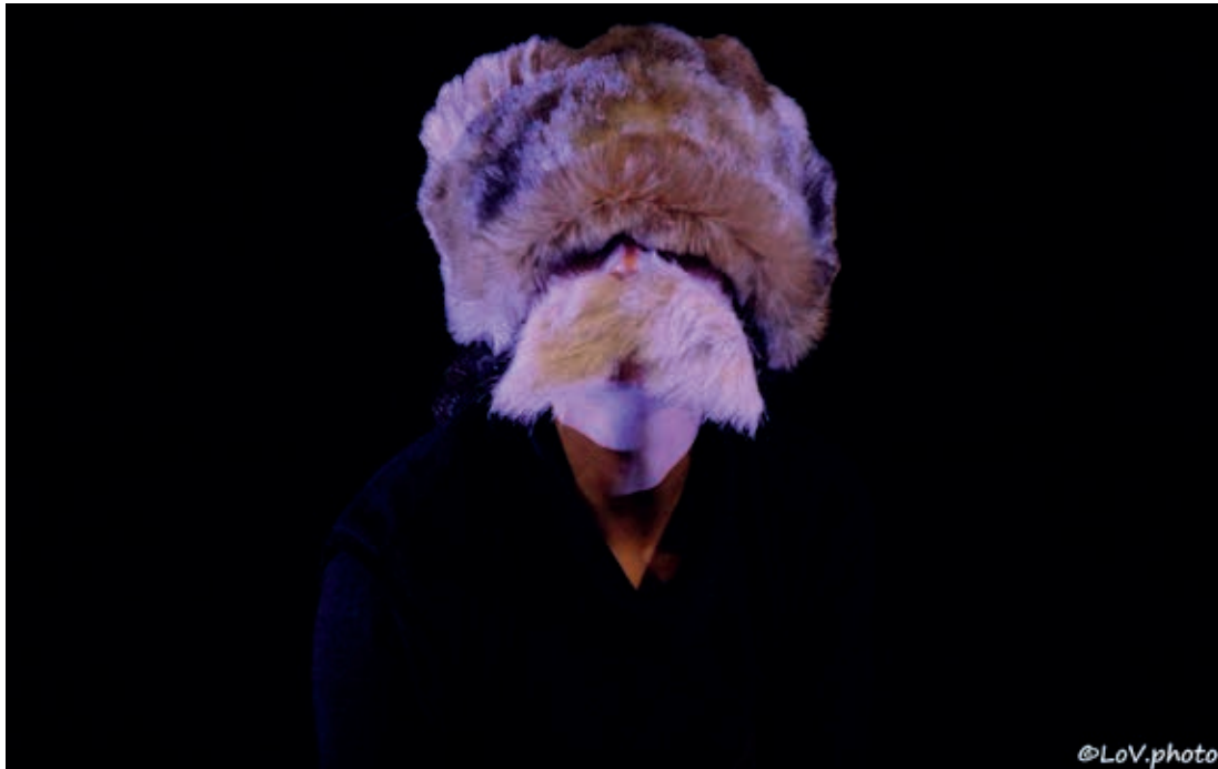
Le grand-père, mécontent

Notre désir est de réaliser une pièce qui émeuve, qui touche à la fois la sensibilité des enfants et celle des adultes : l'exploration de nos peurs et la découverte par un jeune enfant de sa propre force, son émancipation et son honnêteté.